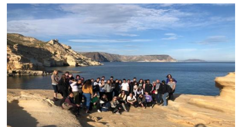
ECHANGE A ALMERIA. Espagne. Janvier 2020