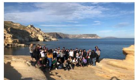
ECHANGE A ALMERIA. Espagne. Janvier 2020